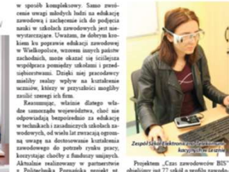
Zespół Szkół Elektroniczno-Telekomunikacyjnych w Lesznie

Dlaczego samorząd województwa wspiera w swojej kadencji zawodowców w Wielkopolsce? Dlaczego warto stawiać na szkolnictwo zawodowe? Obserwacja rynku pracy w Wielkopolsce, niedostateczne oferty szkoleniowe zawodowe do potrzeb rynku pracy oraz trudne zapotrzebowanie przedsiębiorców na pracowników z wykształceniem technicznym – to główne powody, które skłoniły samorząd do podjęcia szeregu działań mających na celu poprawę jakości kształcenia zawodowego w Wielkopolsce. Uspokajanie niedoboru wykształconych specjalistów na rynku pracy możliwe będzie dopiero wraz ze znaczną poprawą jakości kształcenia – zarówno poprzez programy dofinansowania nauczycieli, jak i praktyczne przygotowanie