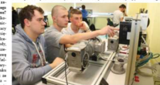
Zespół Szkół Elektroniczno-Telekomunikacyjnych w Lesznie