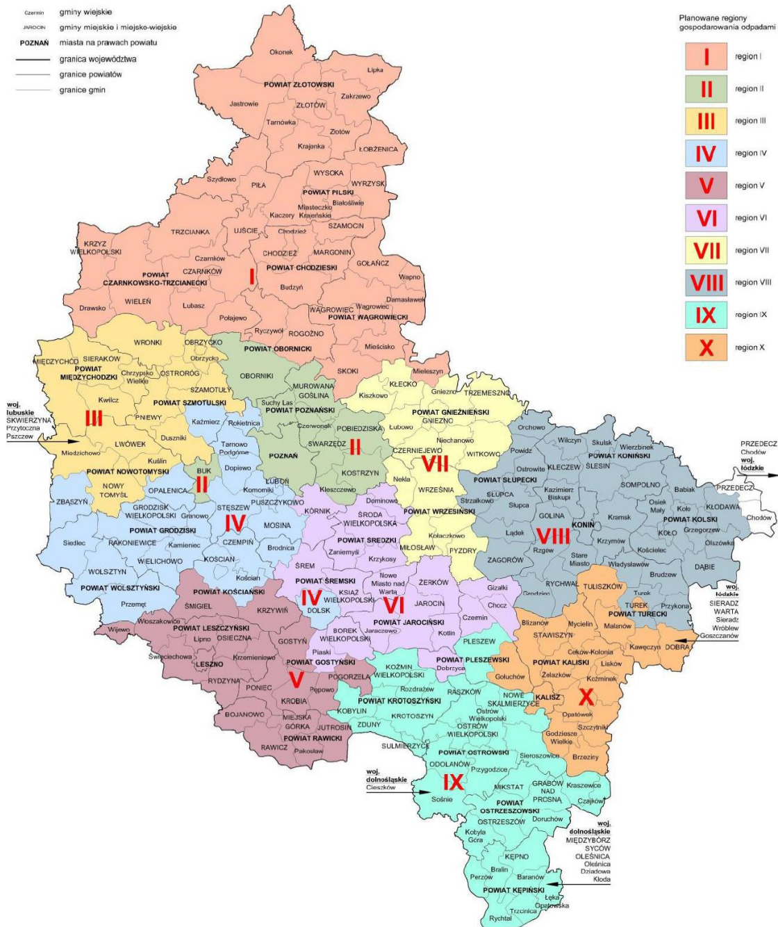
Rysunek 2. Regiony gospodarki odpadami komunalnymi określone w WPGO 2012

WPGO 2012 przewidywał prowadzenie gospodarki odpadami komunalnymi w podziale na 10 regionów gospodarki odpadami komunalnymi (RGOK).