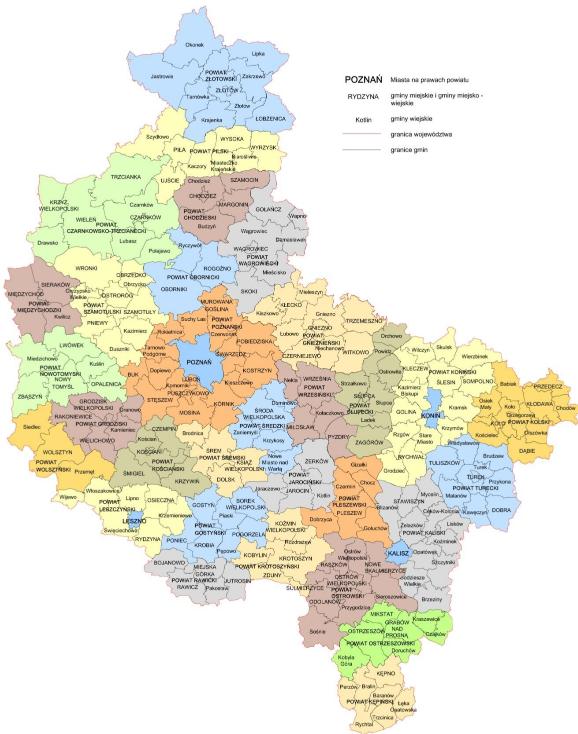
Rysunek 1. Podział administracyjny województwa wielkopolskiego