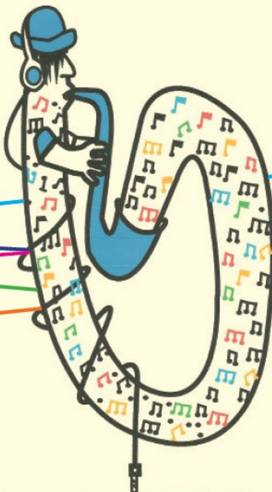
Illustration: Carsten Bredt | E-Mail: L.P.P.A. @ t-online.de