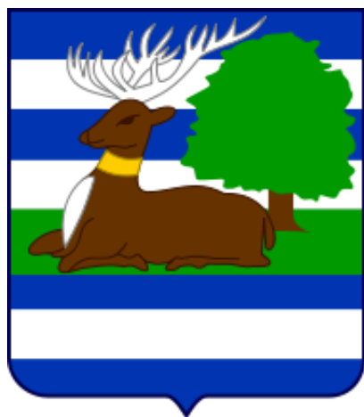
Župania Vukovarsko-Srijemska (Chorwacja)

Dziękujemy za odwiedziny i zapraszamy ponownie