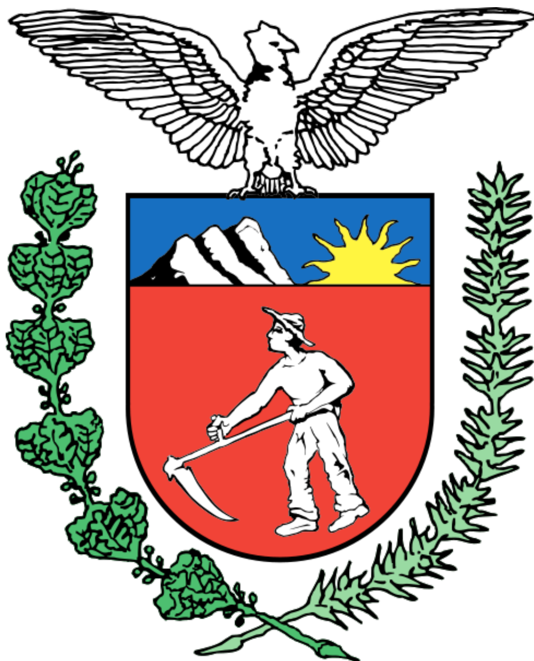
Stan Paraná (Brazylia)