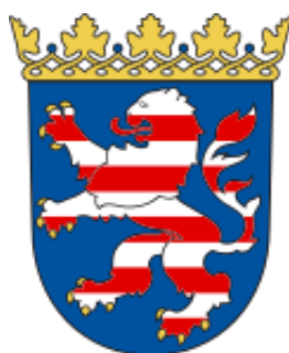
Kraj Związkowy Hesja (Niemcy)