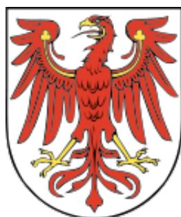
Kraj Związkowy Brandenburgia (Niemcy)